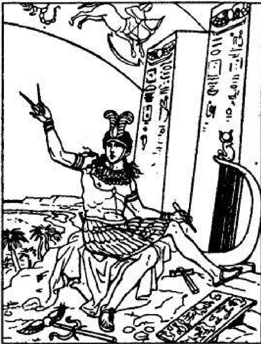
Рис. 1б. Астролог ранних времен (оригинальный рисунок с французского издания)

Мы надеемся, что эта книга послужит толчком для изучения научных трудов современных и древних астрологов.