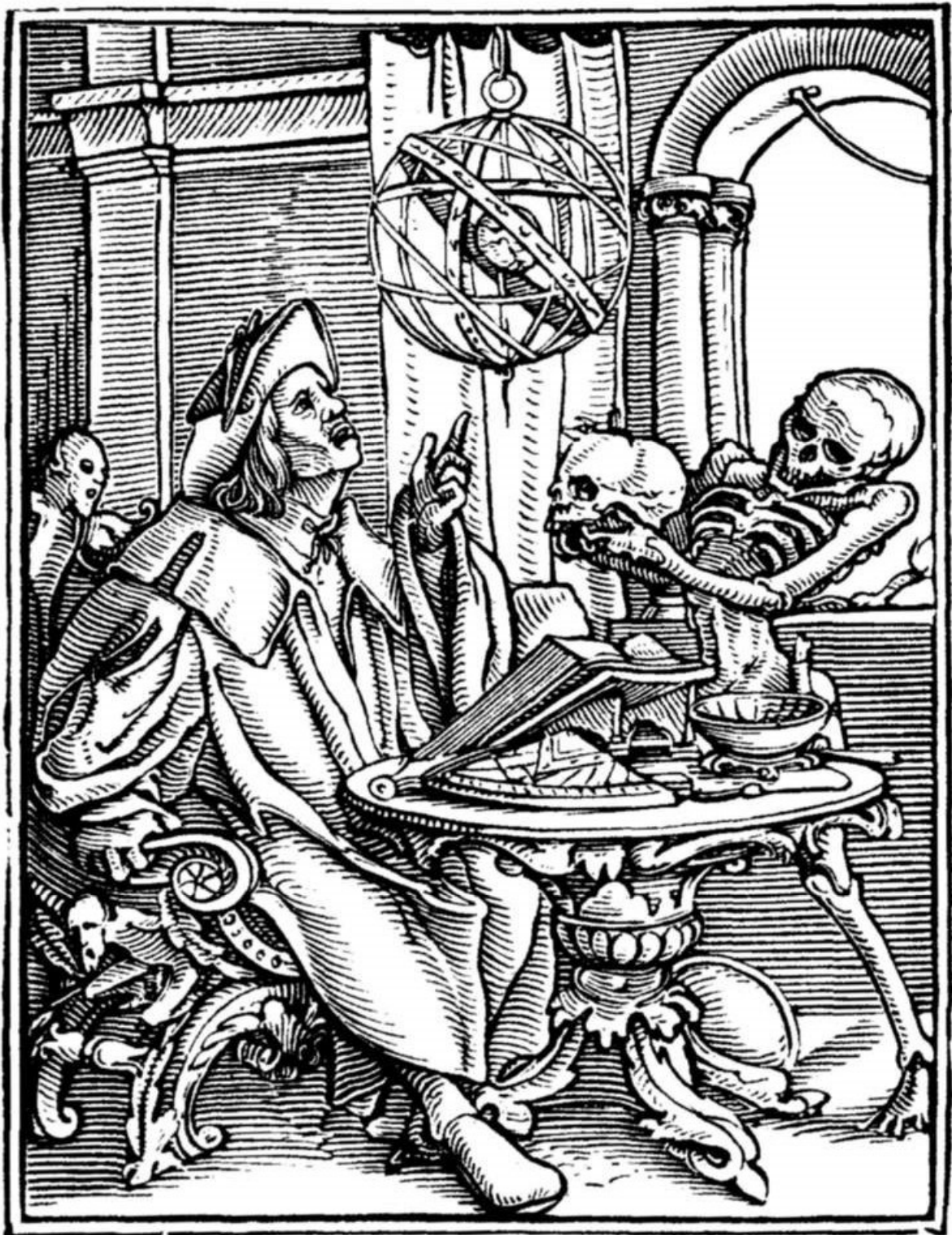
Рис. 1в. Средневековый астролог. (живописец Ганс Гольбейн). Астролог созерцает подвесную небесную сферу. Но смерть держит череп перед его глазами.