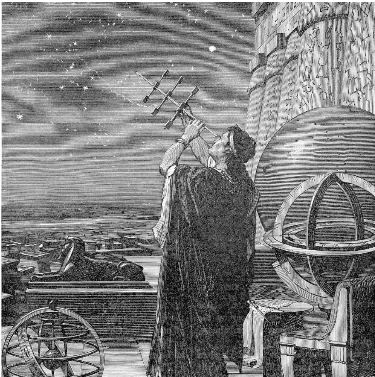
Рис. 1а. Астролог античных времен

Следовательно, базовые знания астрологии необходимы не-офитам для успешного изучения магии, алхимии, мифологии и легенд Священных Книг.